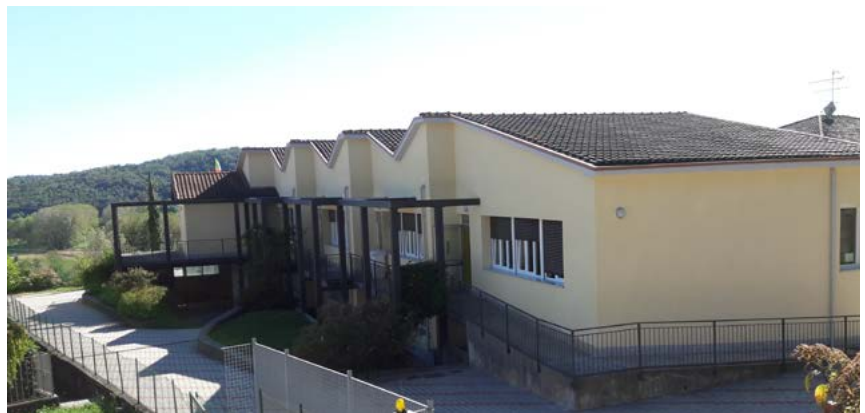
Alcune immagini dei lavori realizzati alla scuola dell'infanzia e primaria

Un'altra importante opera realizzata riguarda l'intervento presso la tribuna del campo di